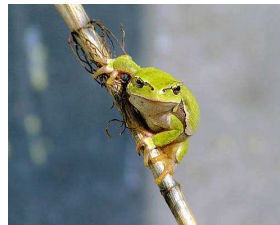
Figura 2: Respuesta: rana